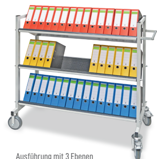
Ausführung mit 3 Ebenen