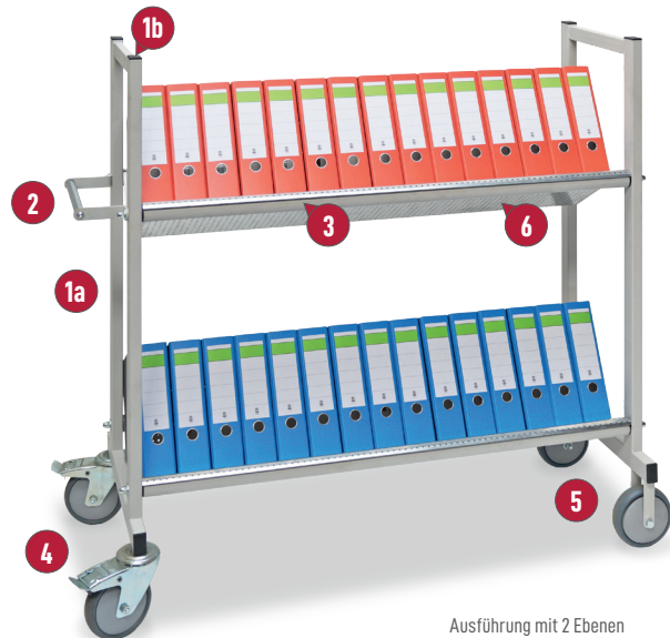
Ausführung mit 2 Ebenen